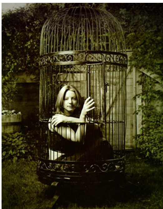
PHOTO D'ARCHIVE de Sarah McLachlan, assise dans une grande cage d'oiseau exotique. La porte est ouverte mais Sarah y demeure néanmoins assise.